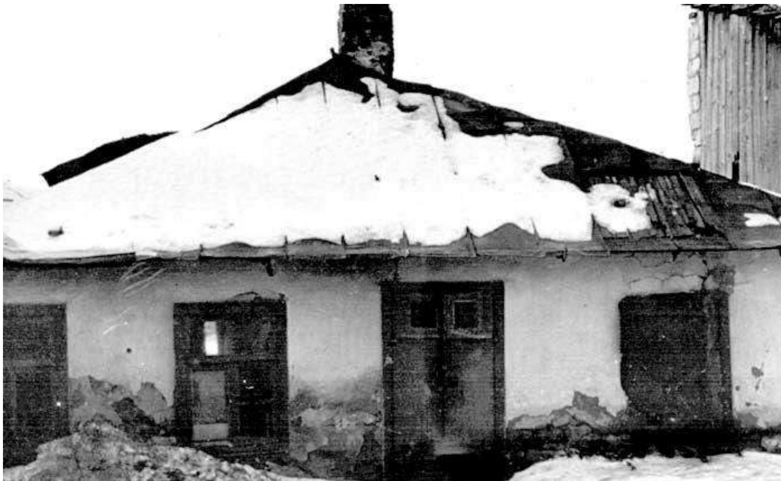
Домик после войны