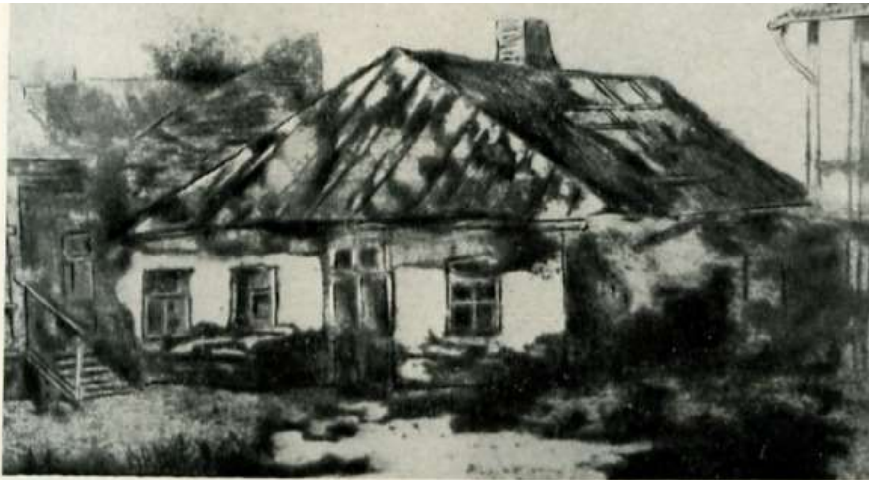
Дом-музей А. С. Пушкина в г. Кишиневе до реставрации. Рис. арх. Ф. Наумова

Судьба домика волновала всех, кто прикасался к его истории. Рисунок Главного архитектора города Кишинева, реставратора Дома-музея А. С. Пушкина. Таким он увидел Домик до реставрации в 1946 году.