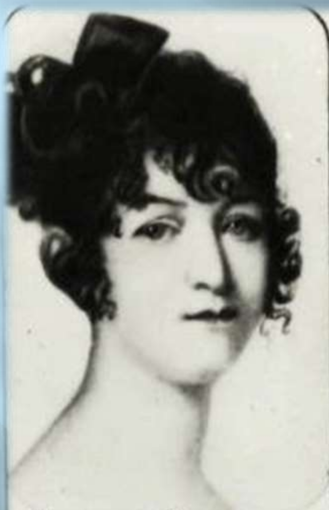
Надежда Осиповна Пушкина - мать