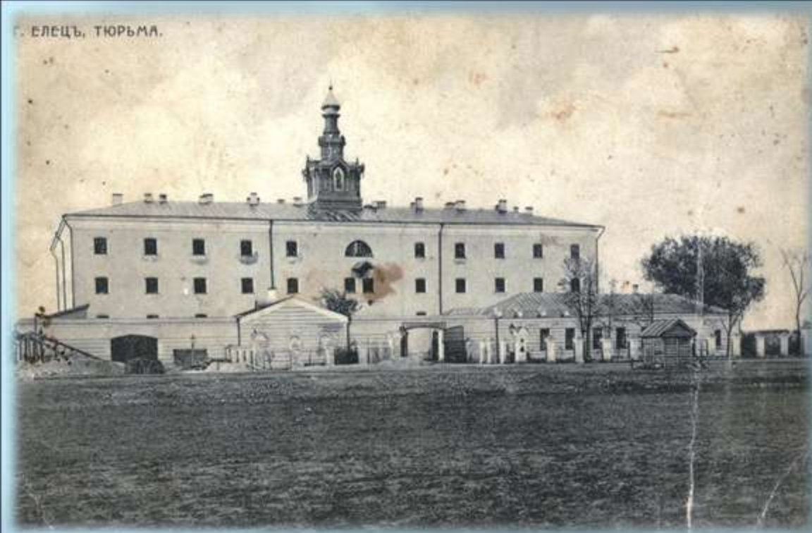
Г. ЕЛЕЦЬ, ТЮРЬМА.