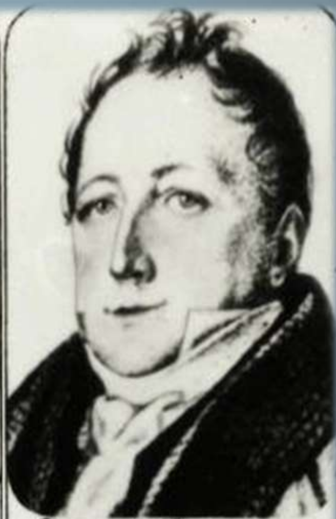
СЕРГЕЙ ЛЬВОВИЧ Пушкин - отец