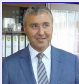
ФАЛЬКОВ Валерий Николаевич, министр науки и высшего образования РФ

Новый нацпроект "Наука и университеты" презентован в декабре 2020 года, пишет "Российская газета". Об этом заявил 10 декабря на открытии выставки "Вузпромэкспо" министр науки и высшего образования Валерий Фальков. "Сейчас проект проходит финальную стадию, когда дается заключение по мероприятиям и показателям. До Нового года он будет презентован", - уточнил министр.