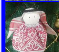
Елочные игрушки из Иордании

духовно-нравственного воспитания детей и молодежи Совета при Президенте Российской Федерации по международным отношениям, Департаментом информации и Печати Министерства иностранных дел Российской Федерации, Всемирным координационным советом Российских соотечественников проживающих за рубежом.